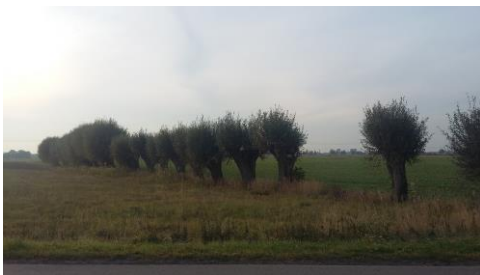
Wierzby głowiaste – bogactwo Żuław