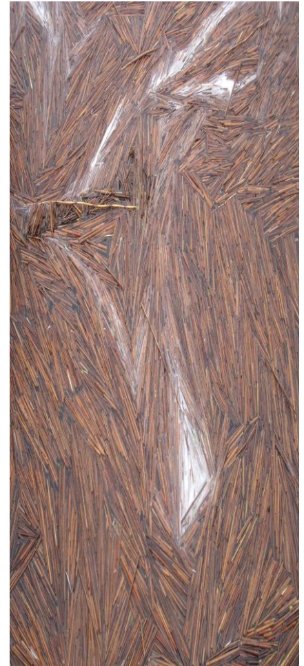
Ułamki sitowia wiosną w wodach Portu Krynica Morska

rozwoju infrastruktury wodniackiej, która będzie generowała w przyszłości znaczny ruch turystyczny na akwenach śródlądowych. Po opracowaniu wniosków z tej narady, opiszemy je także w niniejszym biuletynie.