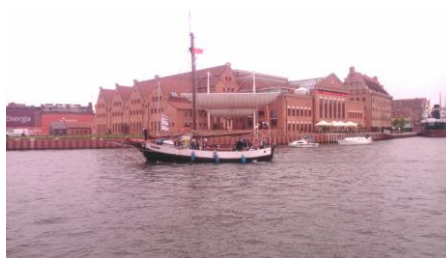
„Generał Zaruski” na tle Filharmonii Bałtyckiej w Gdańsku

Gratulujemy Wielkopolskiej Organizacji Turystycznej !!