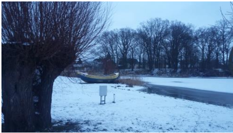
Przystań w Rybinie otulona śniegiem

8 – 10 marca 2016 r. na Uniwersytecie Gdańskim.