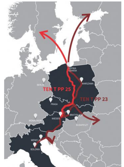
Przebieg korytarza Bałtyk Adriatyk

Korytarz transportowy Bałtyk Adriatyk obejmuje obszar od portów w Gdańsku i Gdyni do portów północnego Adriatyku, Włoch i Słowenii. Skandynawska część korytarza obejmuje połączenie od Oslo aż do Karlskrony. Korytarz łączy 19 regionów, jego długość wynosi 1.700 km. Mieszka w tych regionach 55 mln osób z pięciu krajów członkowskich Unii Europejskiej.