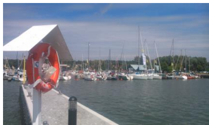
Port w Krynicy Morskiej

Serdecznie zapraszamy zawodników i kibiców !!!