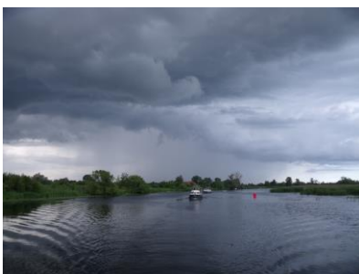
Przed burzą na Kanale Jagiellońskim

Definicja wichury – Zrywa dachy, łamie silne pnie; powstają wysokie góry wodne.