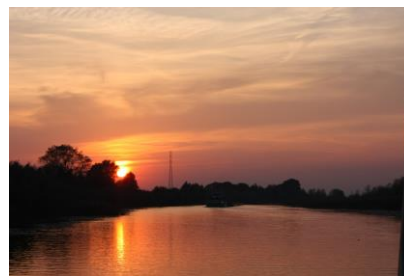
Zachód słońca na Pętli Żuławskiej

Następne spotkanie odbędzie się w dniu 28 maja 2016 r. o godz. 10,00 w Fabryce Sztuk w Tczewie, gdzie