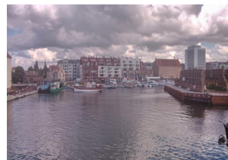
Widok na Marinę Gdańsk z Długiego Pobrzeża

kampanię promocyjną w obszarze Wielkich Jezior Mazurskich i ściągnięcie stamtąd żeglarzy do naszych obiektów. Dotrzymamy danej obietnicy!