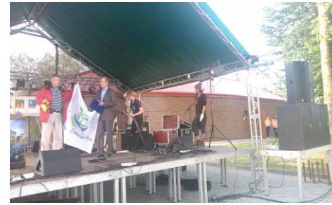
Na przystani w Kątach Rybackich

wiem jak być martwym między falami, ten ciężar stracony, bo tonięcie tylko w połowie to białe milczenie, nic więcej, ale fale wracają kędzierzawymi pieszczotami nienasyconymi paznokciami: nic nie widzieć ani mówić tylko algi jak języki jak piany morskie tylko małe ryby, które chcą jeszcze trzepotać się między moimi kośćcami, nie wiedzieć nie wiedzieć czy mnie słyszysz jak przychodzę w kawalkach, tyle lat później na twoje pomarszczone piaski i jestem tym wrakiem pogryzionym przez słońce tego popołudnia, a morze jest zawsze tak daleko i nigdy się nie kończy.