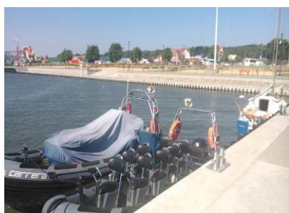
Crazy boat w porcie w Krynicy Morskiej

Spółka Pętla Żuławska nawiązała współpracę z czeska firmą z Pragi, która oferuje domy mieszkalne na wodzie z własnym napędem – dwa lub jeden silnik o mocy 30 KM. Wymiary domu, to 9,7 (11,9) x 4,8 (5,5) mb, powierzchnia mieszalna to 30 m 2 . Nad domem tarasu użytkowy powierzchni ok. 50 m 2 . Waga domu wynosi około 10 t, prędkość maksymalna 12 km/godz. Dom składa się z sypialni, łazienki, pokoju dziennego, aneksu kuchennego oraz tarasu na parterze. Koszt domku to ok. 80.000 euro Zainteresowanych prosimy o kontakt z biurem Spółki.