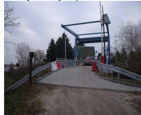
Most zwodzony w Nowej Pasłęce