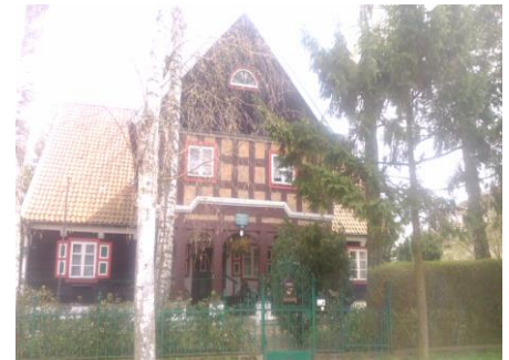
Dom podcieniowy w Żuławkach

Dzisiaj przedstawimy pięć pierwszych zasad kapitana jachtu poruszającego się po Pętli Żuławskiej: