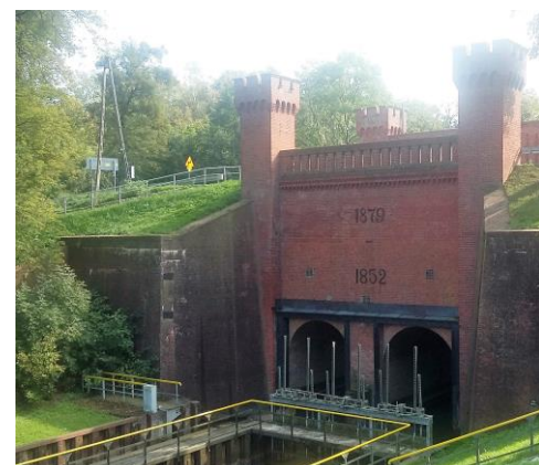
Miejsce, w którym Liwa wpływa do Nogatu

Obsługa ślizzy w Białej Górze, na życzenie wodniaków, podnosi zapory umożliwiające wpłynięcie na rzekę Liwę także większym jednostkom. Polecamy !!