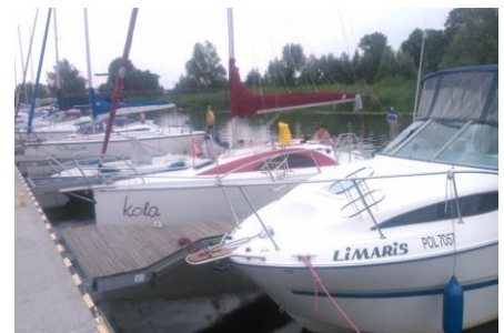
Przystań w Nowej Pasłęce

Pętla Żuławska Sp. z o.o. 82-300 Elbląg; ul. Czerwonego Krzyża 2 Tel/fax: +48 55 2396771 e-mail: petla.zulawska@gmail.com NIP: 5783113012 REGON: 281535246 KRS: 0000482001