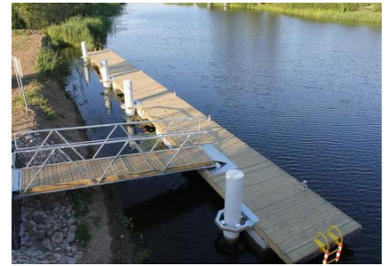
Pomost przy moście zwodzonym w Drewnicy

Zaproszenie na XV Międzynarodowe Regaty im. Jarka Rąbalskiego