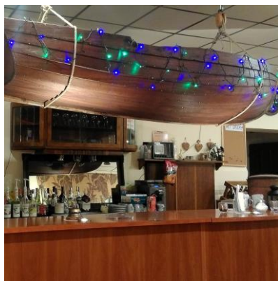
Wnętrze Tawerny Szkarpawianka

Nowy usługa turystyczna w obszarze Pętli Żuławskiej