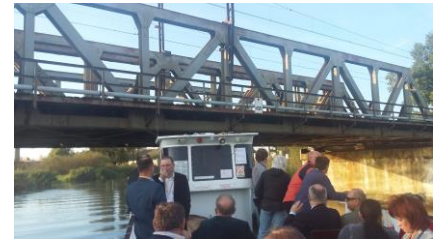
Most kolejowy na rzece Elbląg

W pierwszej części nasi Wspólnicy przyjęli sprawozdanie finansowe Spółki za rok 2016. Zarówno Rada Nadzorcza jak i Zarząd Spółki otrzymali absolutorium za pracę w 2016 roku. W drugiej części zgromadzenia, po przerwie, ustalono nowe zasady wynagradzania Rady i Zarządu Spółki w związku z nowym obowiązkiem ustawowym a także zdecydowano o pokryciu straty Spółki dopłatami proporcjonalnymi do liczby