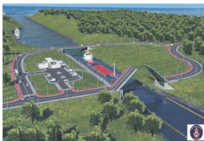
Wizualizacja kanału przez Mierzeję Wiślaną

Ważnym tematem również była kwestia Kanału przez Mierzeję Wiślaną. Przedstawione zostało stanowisko Spółki przychylnie projektowi.