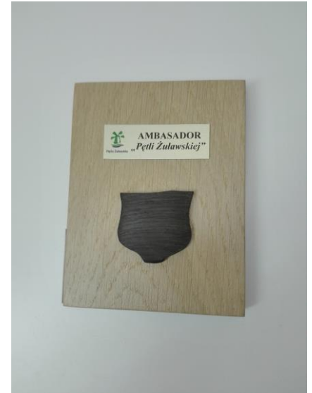
Statuetka Ambadora Pętli Żuławskiej

Wręczenia dyplomów i statuetek odbędzie się podczas regionalnej konferencji South Coast Baltic i spotkania nawigacyjnego w dniu 15 marca 2019 r. w Hotelu Młyn w Elblągu ul. Kościuszki 132. Początek godz. 10,00