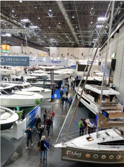
Stoisko z łodziami ekologicznymi