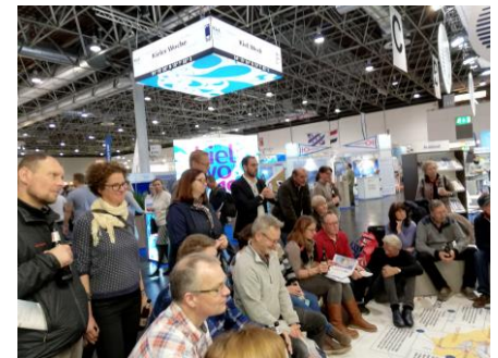
Nasi goście na stoisku SCB

Jak zwykle w styczniu odbyły się chyba największe w Europie targi żeglarskie BOOT 2019. Tym razem reprezentacja Pętli Żuławskiej przebywała w Dusseldorfie od 18 do 22 stycznia. Wspólne stoisko regionów współpracujących ze sobą, w ramach projektu INTERREG Va pn. South Coast Baltic, obsłużyła kilka tysięcy gości, a bezpośrednie rozmowy przeprowadzono z ok. 1000 odwiedzających.