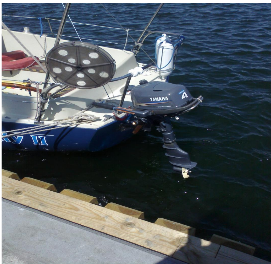
Zdjęcie nr 2. Widok na zamocowany na rufie jachtu silnik zaburtowy

W dniu 5 lipca 2013 r. Holly II wznowił podróż. Około godz. 13:00 załoga odcumowała od nabrzeża przystani klubu Neptun z zamiarem dopłynięcia do portu w Helu. Podróż z Górek Zachodnich rozpoczęto na żaglach. Po pewnym czasie ze względu na niekorzystne do żeglowania warunki wiatrowe (bardzo słaby wiatr) kapitan jachtu zrzucił żagle i uruchomił najpierw silnik zaburtowy, a następnie silnik główny.