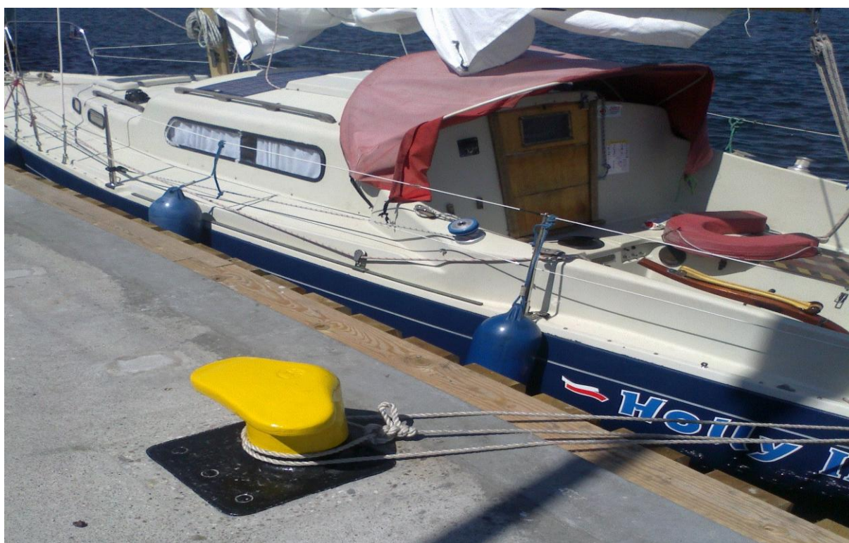
Zdjęcie nr 1. Jacht Holly II zacumowany w porcie Hel